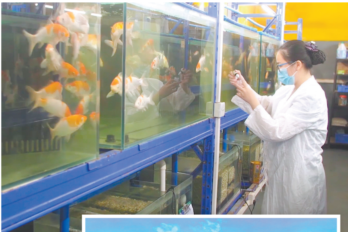
↑ 海豚水族科研人员在实验室工作。 → 海豚水族业务量保持稳步增长。