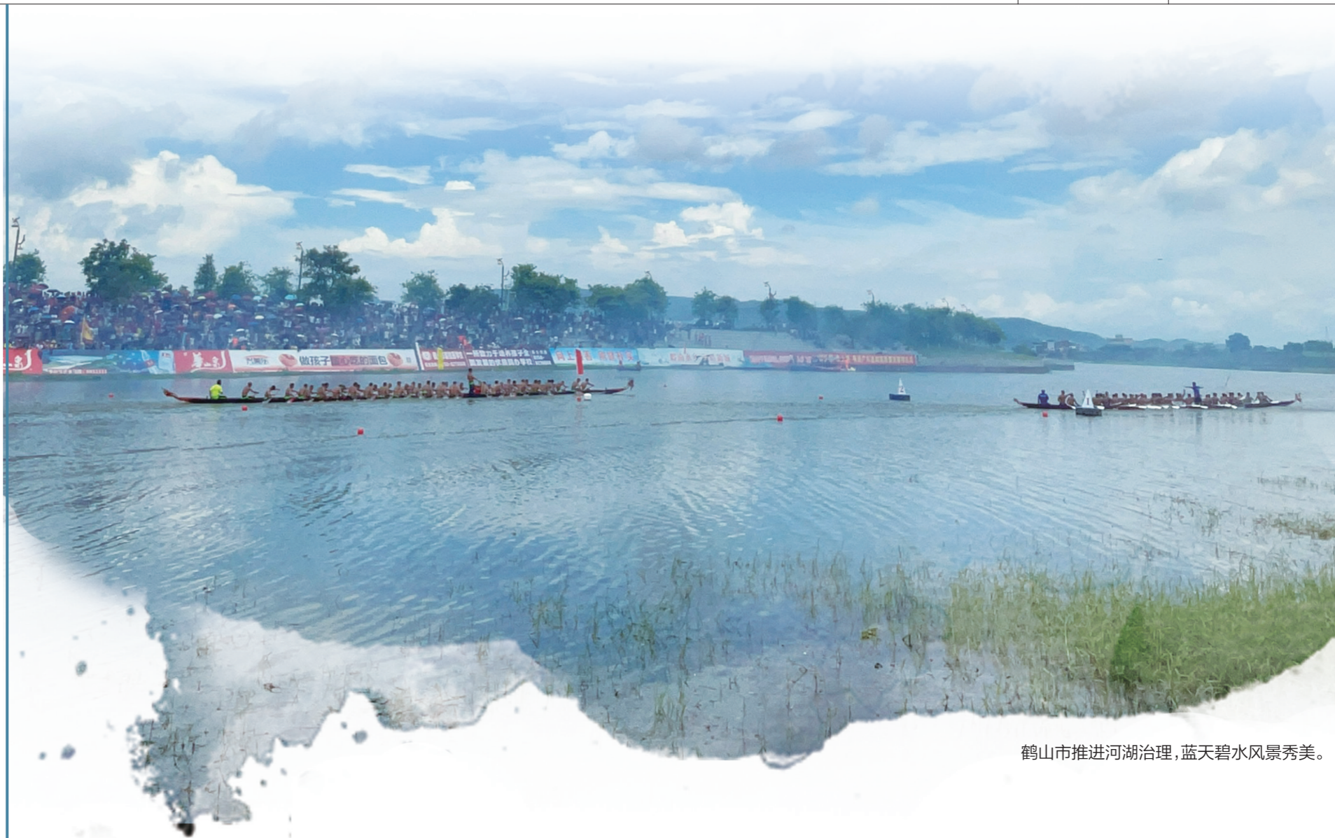
鹤山市推进河湖治理，蓝天碧水风景秀美。