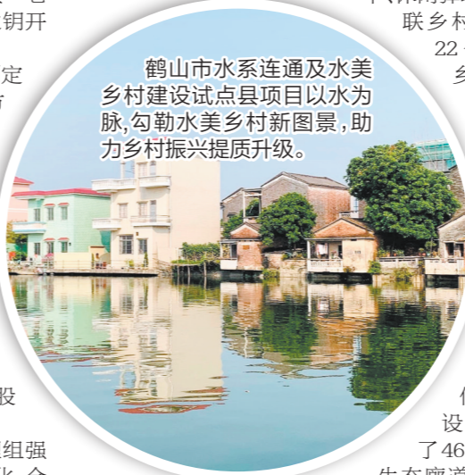
鹤山市水系连通及水美乡村建设试点县项目以水为脉，勾勒水美乡村新图景，助力乡村振兴提质升级。