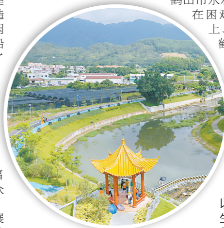
鹤山市坚持以水为媒，串联生态碧道新路径，为群众打造亲水休闲生态廊道。