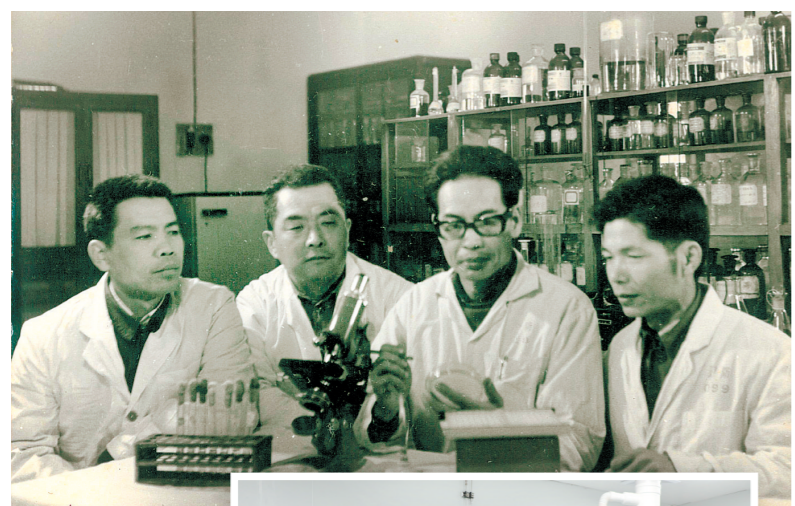
↑ 江门卫生防疫站的成立,开启了江门疾控事业的新纪元。