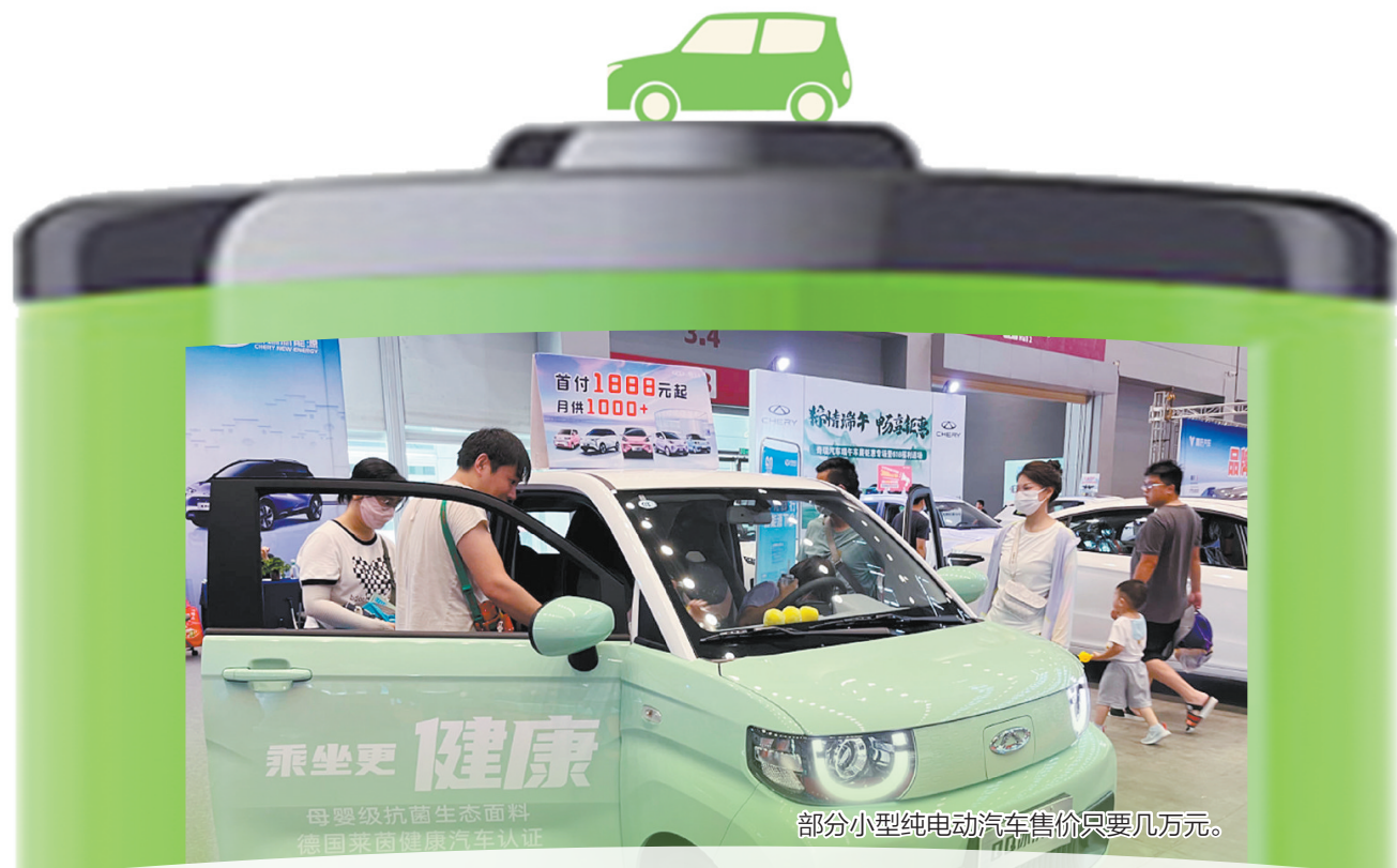
部分小型纯电动汽车售价只要几万元。