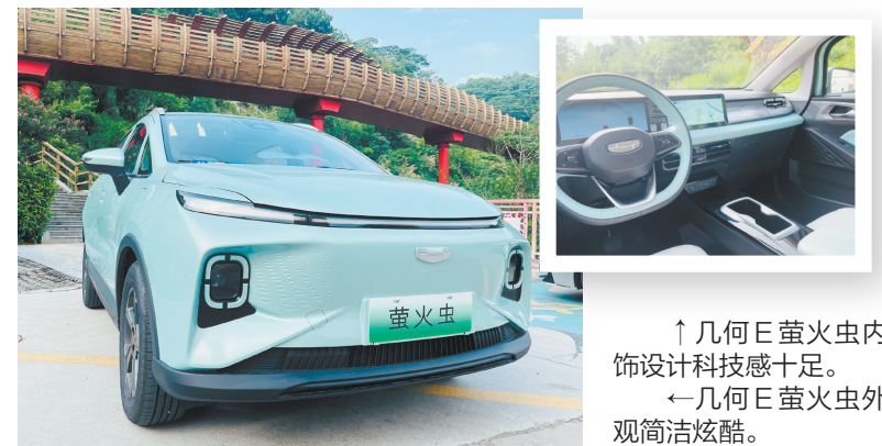
↑几何E萤火虫内饰设计科技感十足。 ←几何E萤火虫外观简洁炫酷。