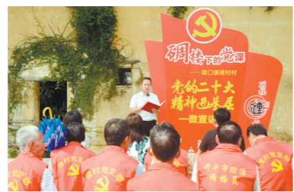
江门把文明培育作为信仰植入的“育种”，打造艺术党课、七彩“流动课堂”等基层理论宣讲特色品牌。图为“碉楼下的党课”走进基层党员群众。