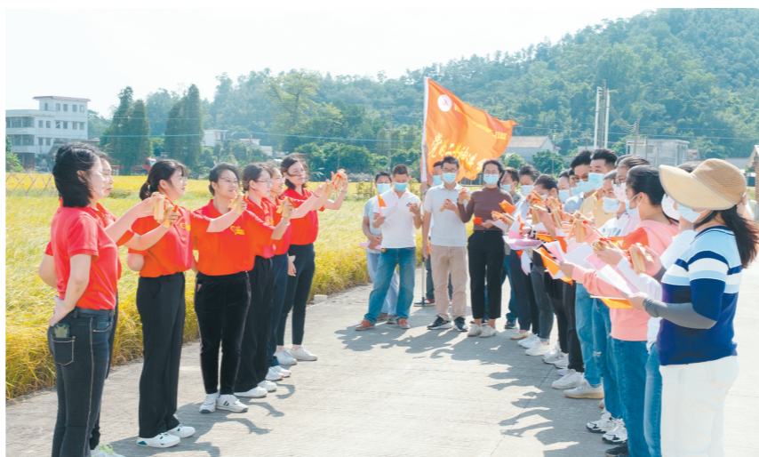
江门构建新时代文明实践“结对矩阵”，打造形成更具“侨”味、“乡”味、“趣”味、“情”味的新时代文明实践“江门模式”。此前江门在文明实践方面做了不少探索，图为音乐党课走进基层。

“纵深”是指在已有1530多个新时代文明实践阵地这个基础上，做好下半篇文章，确保我市文明单位与新时代文明实践中心结对共建工作扎实推进、落地见效。“拓展”则是要聚焦侨乡特色，将目光对准更广泛的社会力量、资源，充分调动机关单位、“两新”组织、企业、文化场馆的积极性、主动性，发挥各单位自身优势，建立文明实践点或驿站，并积极与属地的文明实践中心、所、站工作结合，将自己的资源对外开放，让周边群众共享，更好满足广大群众对文化生活的需