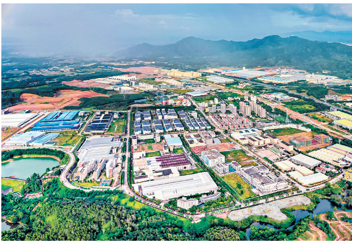
翠山湖高新区扩容提质,打造更具竞争力的现代化产业园区。