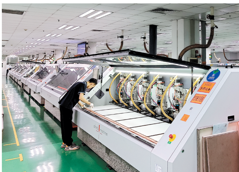
先进制造业助推开平经济高质量发展。