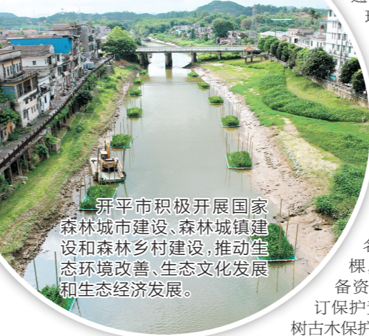
开平市积极开展国家森林城市建设、森林城镇建设和森林乡村建设,推动生态环境改善、生态文化发展和生态经济发展。

开平市林业局按照《广东省林业局关于印发〈国家森林乡村评价认定工作实施方案〉的通知》开展森林乡村建设,通过属地镇村提供申报材料、林业主管部门现场核查的方法,落实森林乡村申报认定工作。目前,苍城镇联兴村、大沙镇岗坪村、蚬冈镇群星村等6个乡村已通过国家森林