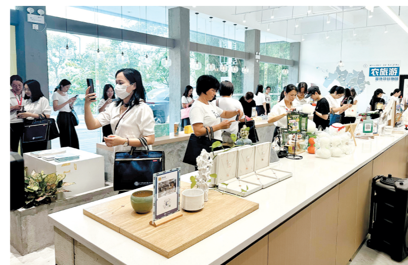
培训班为学员们带来农村电商理论和新媒体视频拍摄实训教学。

据悉,2021年以来,开平市以党建引领、精准培育、赋能增效为发力点,开展“巾帼头雁”导师帮带工作,助力农村女“头雁”走上成长快车道。两年来,开平市共有6位导师得到提拔或职级晋升,5名“巾帼头雁”荣获“全国巾帼建功标兵”“广东最美河湖水手”等荣誉。其中,县、镇两级帮带导师发挥职能优势,积极帮助支持结对帮带村开展“我为群众办实事”实践活动。例如,开平市林业局帮带导师在赤水镇高山村开展送树苗下乡活动,为群众休闲活动提供舒适的绿化场所;蚬冈镇坎田村在导师的协调指引下,为取水难的龙冲浪片区修建深水井,解决片区农田灌溉用水问题。