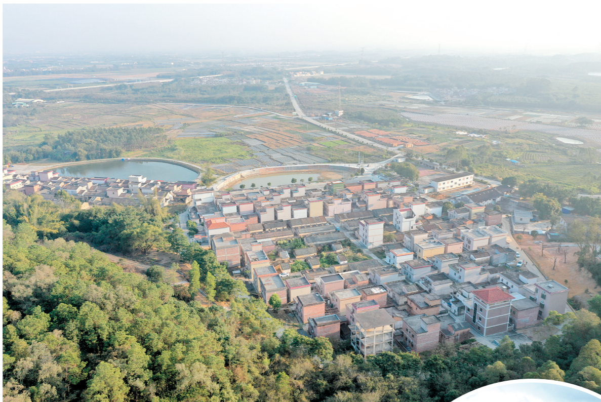
▲开平市马冈镇红丰村通过广东省森林乡村认定。

做好森林资源的保护和开发,压实责任主体是关键。开平市结合自身实际,制定了全面推行林长制工作实施方案,进一步完善林长制组织、制度体系和运行机制。目前,开平设