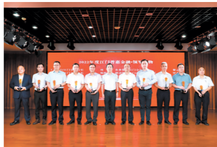
2022年度江门普惠金融·领军人物获奖奖杯。