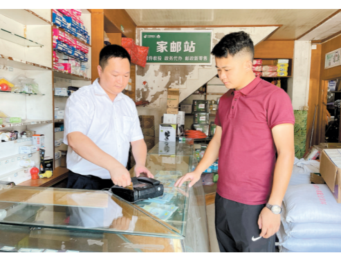
村民在“福农驿站”取钱,既省时又省力。

江门日报讯(文图 记者 陈倩婷/吕胜根 通讯员/冯创志)“村里一天有五六班公交车到镇上,村民取钱很不方便,有了‘福农驿站’,村民在‘家门口’就能取钱,既省时又省力。”近日,记者走进恩平市那吉镇黄角村,就被村口的“福农驿站”所吸引,村民们对该驿站均赞不绝口。