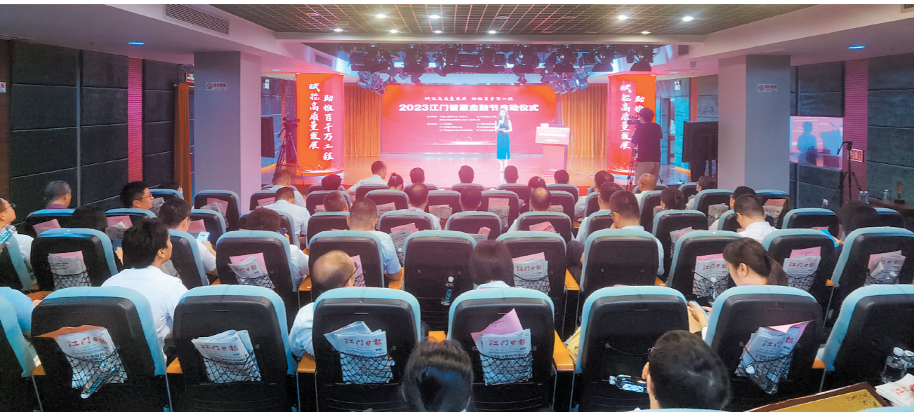
普惠金融节活动现场。