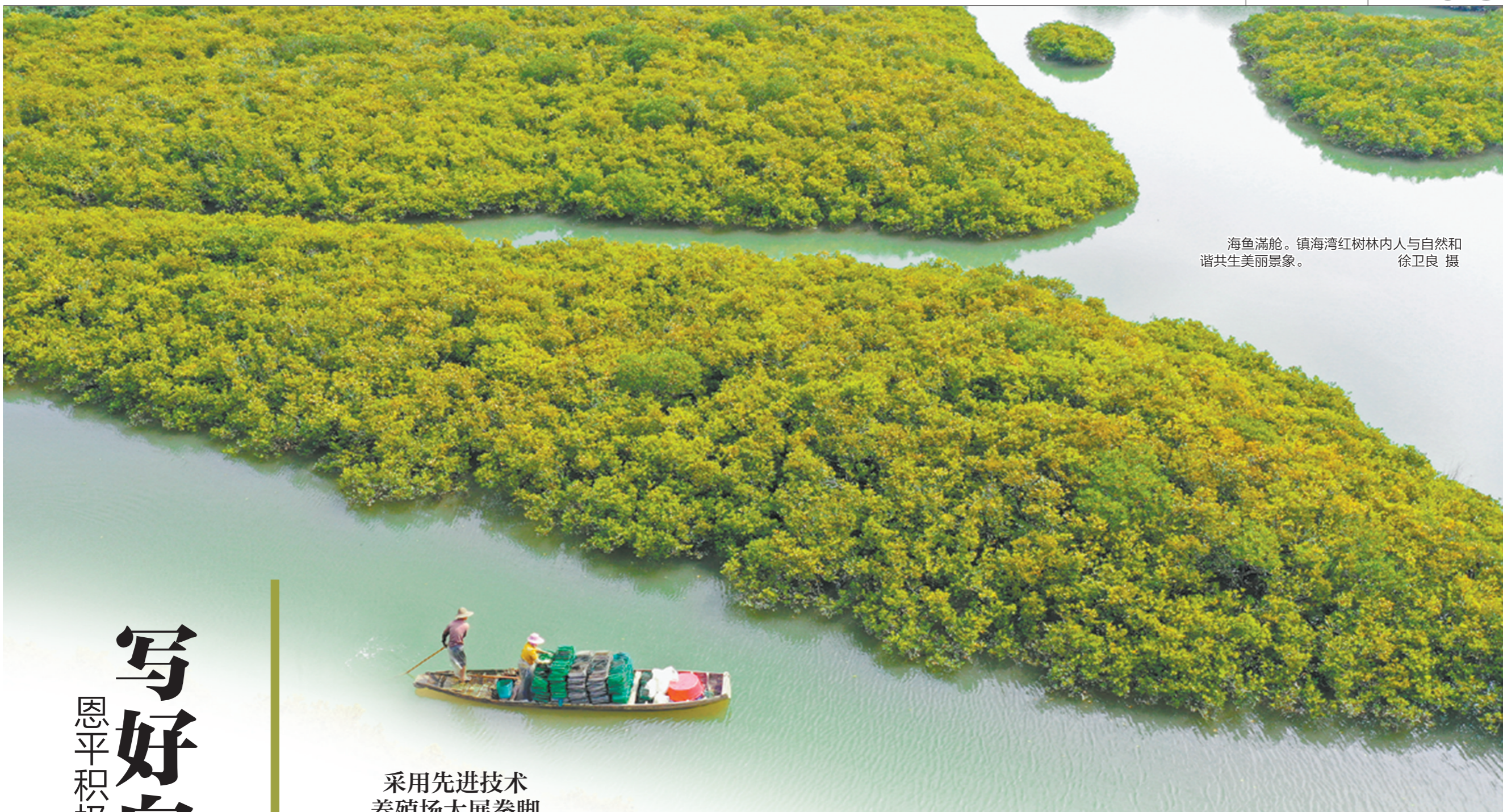
海鱼满舱。镇海湾红树林内人与自然和谐共生美丽景象。