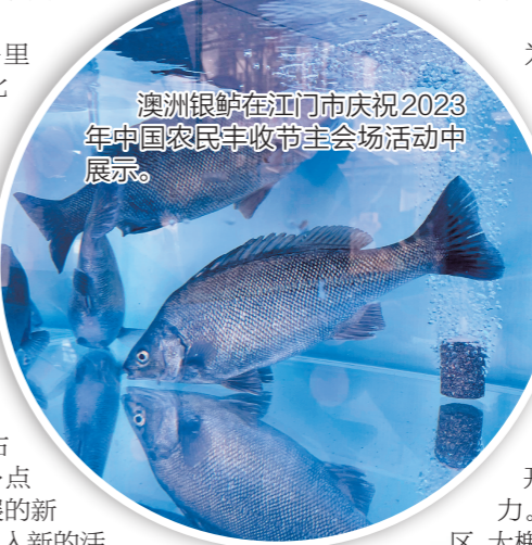
澳洲银鲈在江门市庆祝2023年中国农民丰收节主会场活动中展示。

海洋经济的开发有着无穷的潜力。展望未来，恩平市区、大槐集聚区等经济发展重地与镇海湾的连接将越来越紧密，在市场、技术、功能等因素的共同推动下，恩平向海而兴的步伐将迈得越来越扎实。