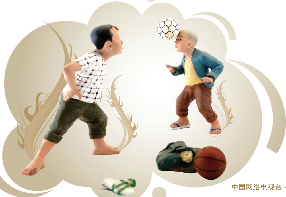
中国网络电视台·天津泥人张彩塑工作室

少年强 中国强 把书包放在路边， 把责任扛在双肩。 民族复兴少年梦圆， 国脉因你强劲刚健， 把书放在路边， 把责任扛在双肩。