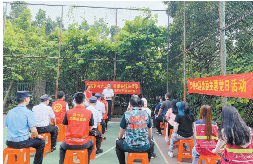
天福社区组织党员代表、居民代表、志愿楼长、物业管家等协商议事。

在社区党委、物业党支部推动下，去年起，骏景湾豪庭借鉴社区网格化管理经验，将小区划分为3个片区，每个片区配备社区网格员以及小区保洁员、治安员、工程员、楼栋管家，推行