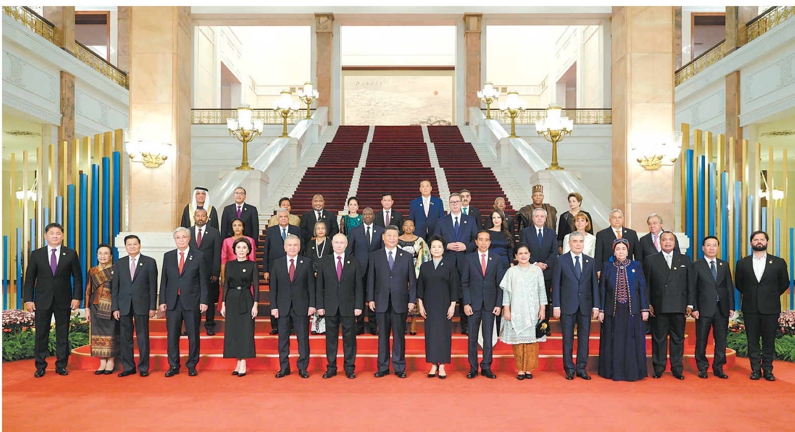
10月17日晚,国家主席习近平和夫人彭丽媛在北京人民大会堂举行宴会,欢迎来华出席第三届“一带一路”国际合作高峰论坛的国际贵宾。这是习近平和彭丽媛同国际贵宾合影留念。

新华社北京10月17日电 10月17日晚,国家主席习近平和夫人彭丽媛在人民大会堂举行宴会,欢迎来华出席第三届“一带一路”国际合作高峰论坛的国际贵宾。李强、赵乐际、王沪宁、蔡奇、丁薛祥、李希、韩正出席。秋日北京,夕阳入画,天安门广场华灯绽放,人民大会堂庄严肃穆。