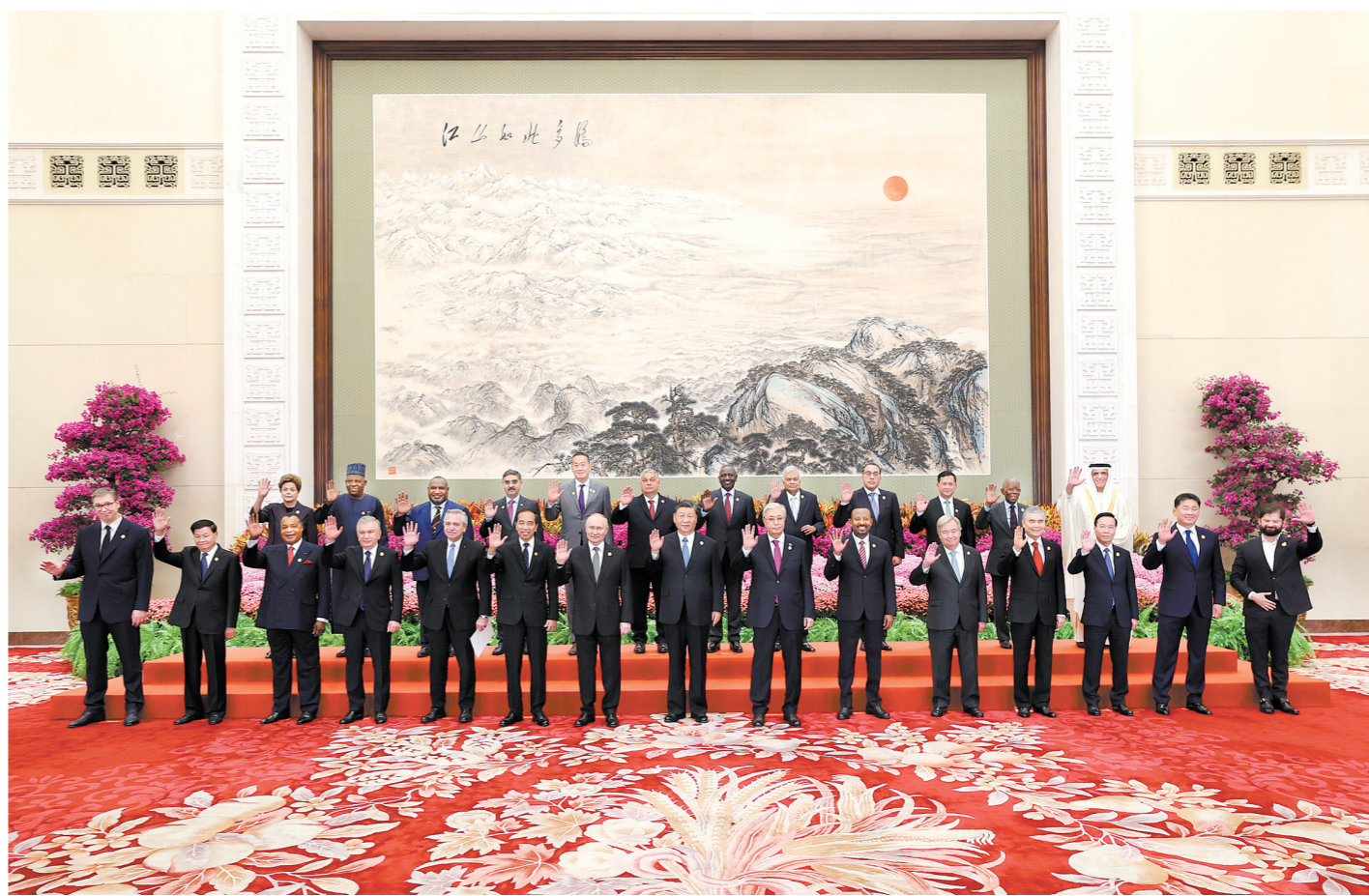
习近平同出席高峰论坛的外国国家元首、政府首脑和国际组织负责人等国际贵宾集体合影。

新华社北京10月18日电 10月18日上午,国家主席习近平在人民大会堂出席第三届“一带一路”国际合作高峰论坛开幕式并发表题为《建设开放包容、互联互通、共同发展的世界》的主旨演讲。习近平宣布中国支持高质量共建“一带一路”的八项行动,强调中方愿同各方深化“一带一路”合作伙伴关系,推动共建“一带一路”进入高质量发展的新阶段,为实现世界各国的现代化作出不懈努力。