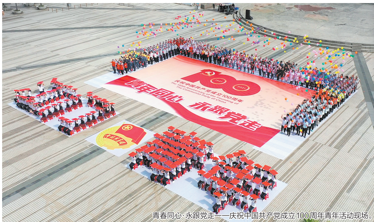
青春同心 永跟党走——庆祝中国共产党成立100周年青年活动现场。