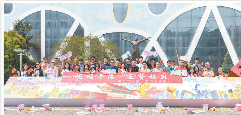
祝福香港 点赞祖国——江港澳青年交流活动现场。