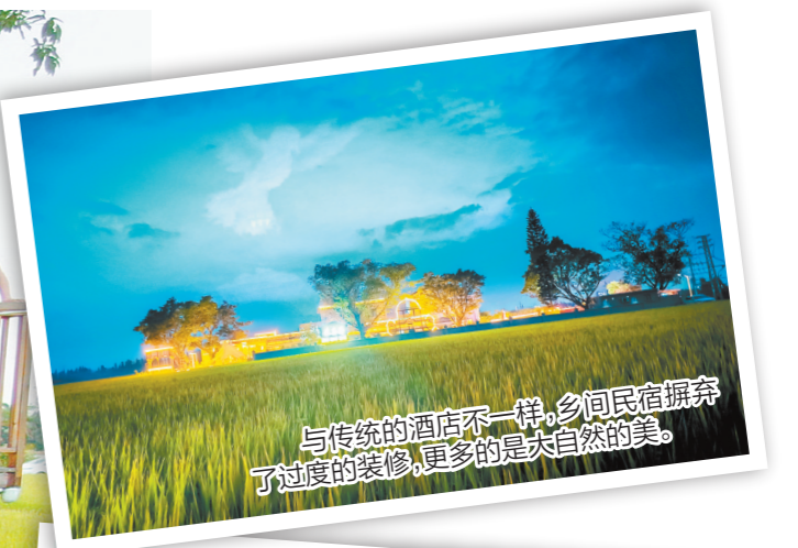
与传统的酒店不一样,乡间民宿摒弃了过度的装修,更多的是大自然的美。