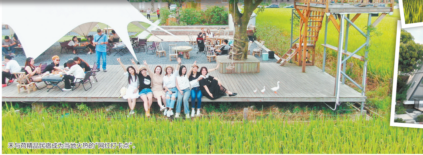
禾与荷精品民宿成为当地火热的“网红打卡点”。