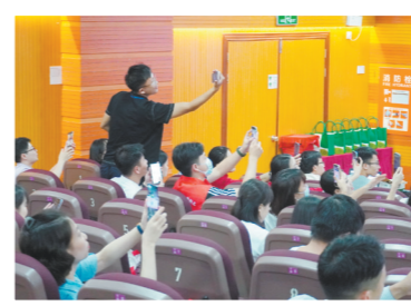
↑ 现场观众为喜爱的选手投票。