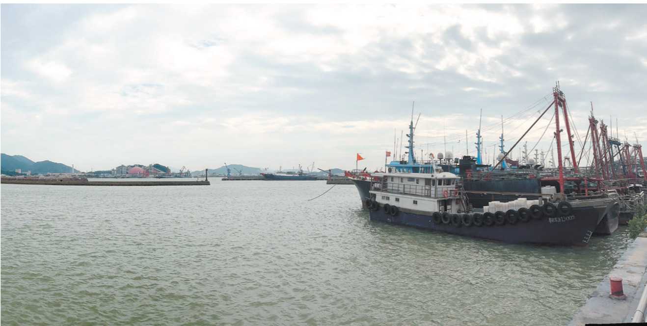
崖门渔港正在全力打造粤港澳大湾区休闲渔业与滨海旅游枢纽平台,引进企业兴建崖门渔人码头,提供海上旅游等服务。

从外部看,国家“造大船出远海”“海洋生态保护”等系列政策导向,叠加“海上交通”“小鱼归港”等趋势,我市渔港主要依赖的传统渔业生产功能日渐弱化。同时,周边竞争日益增大,阳江的闸坡、东平渔港,珠海的洪湾渔港等均是国家级中心渔港,而我市不仅等级渔港数量偏少,基础设施也相对落后,且尚未有国家级中心渔港。