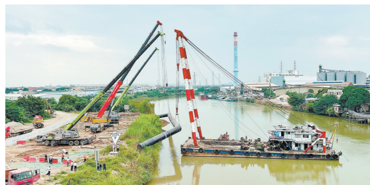
江海区供水“主动脉”进一步畅通施工现场。

江门日报讯(文/图 记者/张海洋 通讯员/谭锡源) 记者从江门市水务环境股份有限公司获悉,江门五邑路(外海大桥至江门大道段)给水工程——江门水道段新礼大桥DN1600给水管过河沉管施工已于近日顺利完成,并经水压试验一次性安装成功。该过河管道施工环境复杂,技术难度大,专业性强,是整个项目顺利建成通水的关键节点之一,进一步畅通了江海区供水“主动脉”。