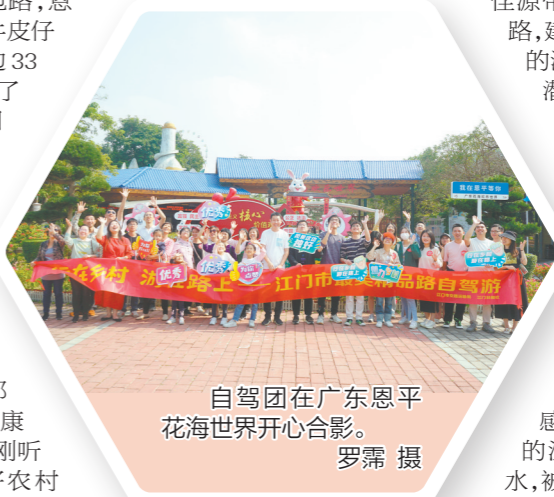
自驾游在广东恩平花海世界开心合影。

顺着恩平市县道X831线恩城牛皮仔至良西那湾段自驾,也藏着另外一个“花海世界”,沿途有多个绿化公园,其中最大的为官粉紫荆花林,占地约1万平方米,另外还有占地6000平方米的大花紫薇花林,占地5000平方米的荷花玉蕊花林和占地4000平方米的黄花风铃木林,在这里,春有黄花风铃木、夏有凤凰木、秋有美人树、冬有山樱花,春夏秋冬,各美其美。