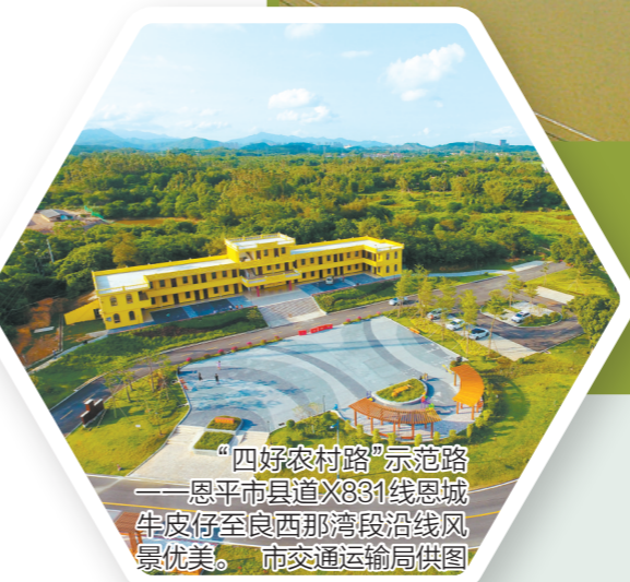
“四好农村路”示范路——恩平市县道X831线恩城牛皮仔至良西那湾段沿线风景优美。

侨都大地,一条“四好农村路”在村落之间蜿蜒起伏,串联“山水林田、城镇村景”,激活一个个“有颜值又有产值”的美丽乡村,构建一条条“畅、安、舒、美”的致富路、民心路、幸福路。为深入推进乡村振兴、交旅融合宣传工作,11月25日,江门市交通运输局开展主题为“行在乡村 游在路上”最美自驾精品路线自驾游活动,选取我市“全国美丽乡村路”“广东省十大最美农村公路”等一批有代表性的自驾精品路线,面向社会组织自驾车队“沉浸式”采风游览,体验路路文化、挖掘路路价值,看四通八达的农村公路如何化作经济脉络,见证乡村发展巨变,联通百姓小康生活。同时,该活动以全媒体形式,全方位、多角度地向广大游客展示“四好农村路”,以及江门的乡村新面貌、发展新动能,让更多人发现“风景这边独好”的乡村美貌,吸引更多的人“行在乡村、游在路上”。