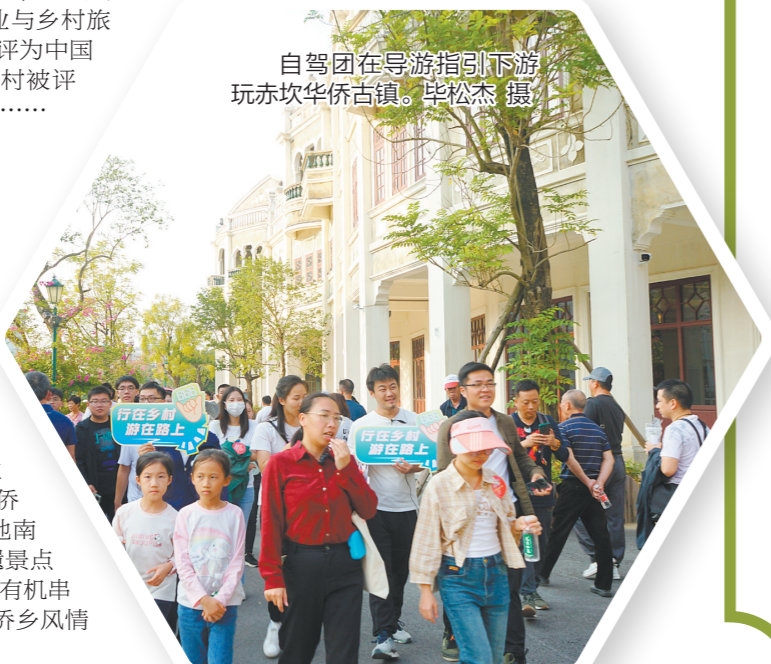
自驾游在导游指引下游玩赤坎华侨古镇。