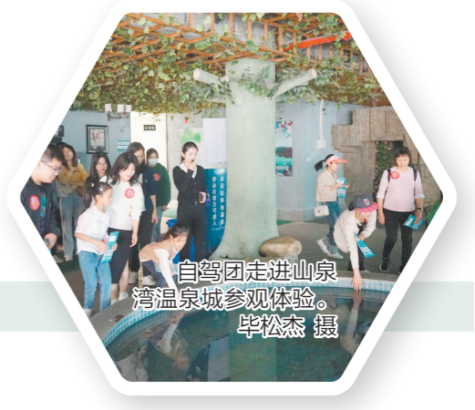
自驾游走进山泉湾温泉城参观体验。