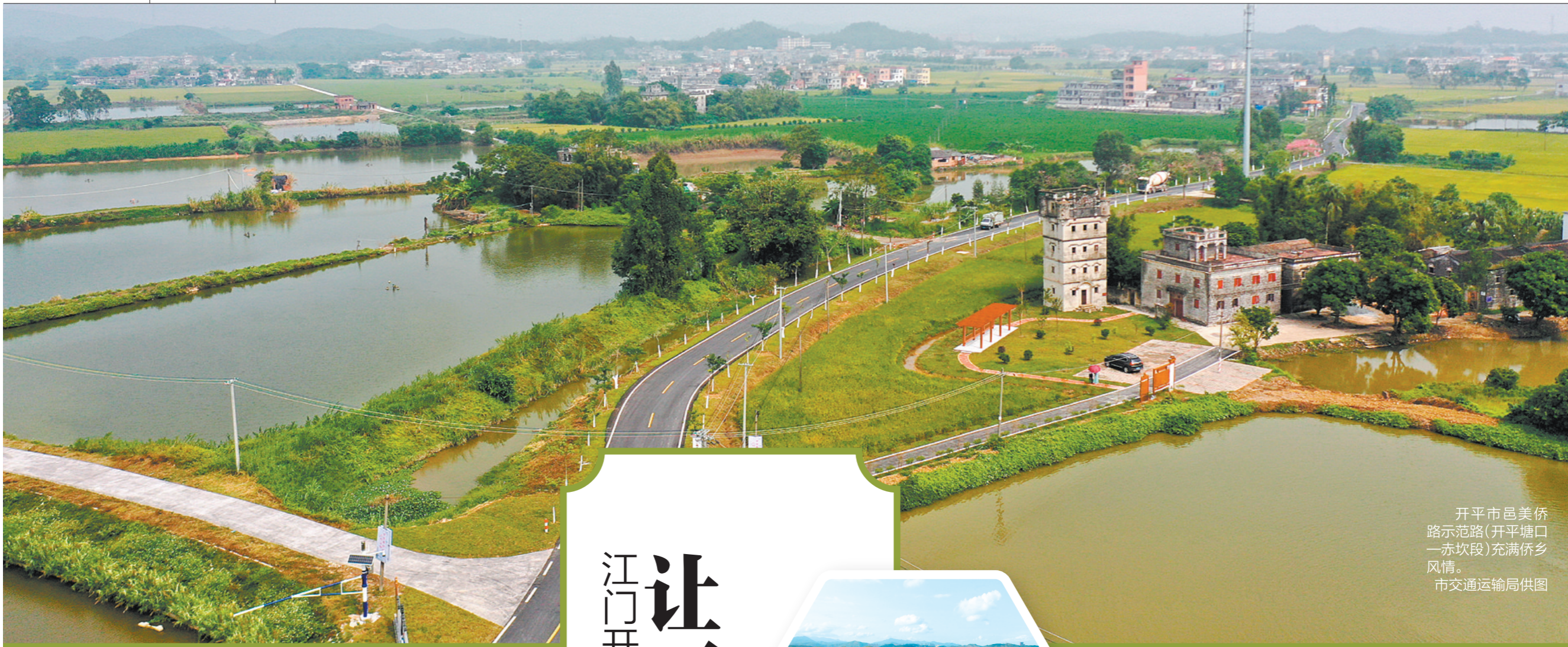
开平市邑美侨路示范路(开平塘口一赤坎段)充满侨乡风情。