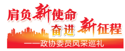
肩负新使命 奋进新征程 ——政协委员风采巡礼