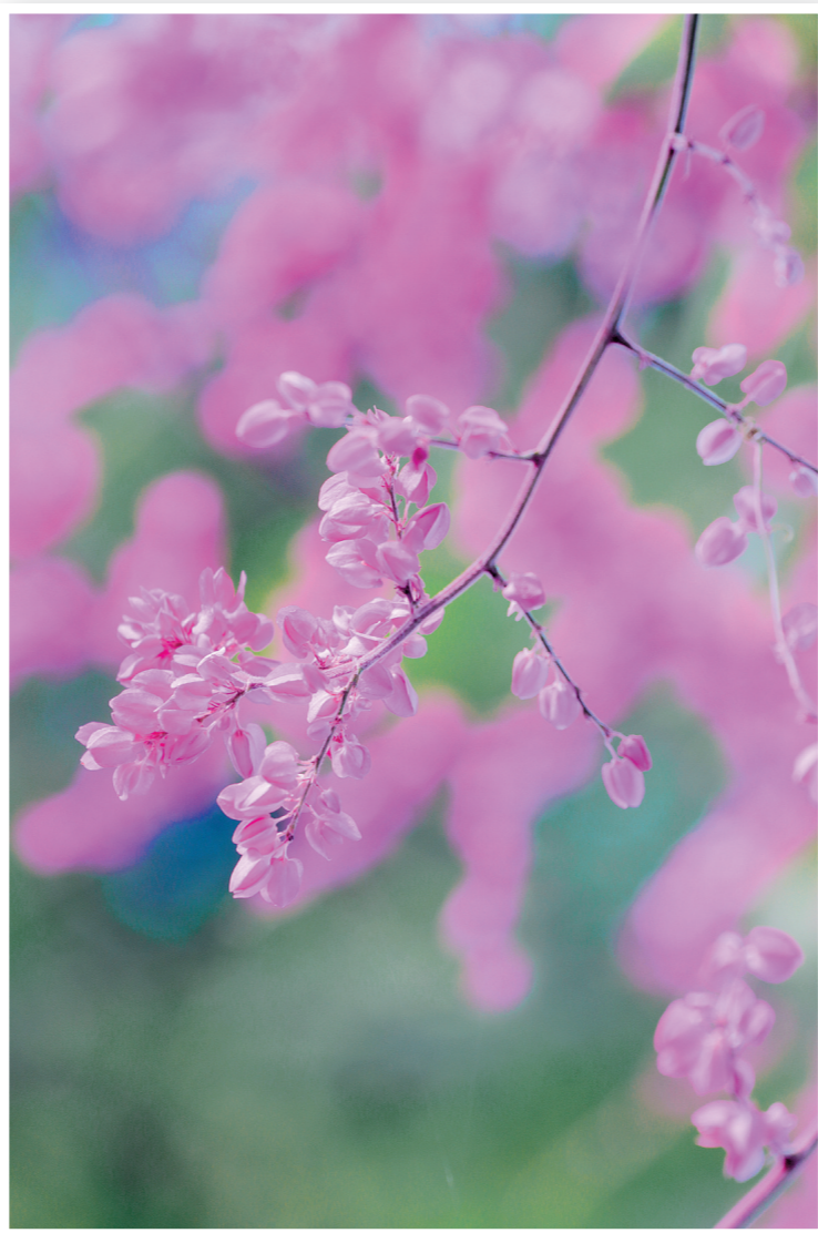
《紫艳慕秋色》