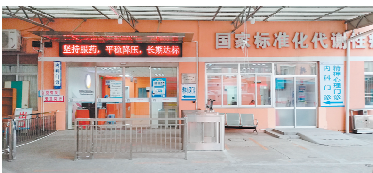
江门市中心医院江海分院精神心理门诊位于该院3号内科楼一楼。

有需求的市民，可按照以下流程，进行线上预约：1.关注“江门市中心医院江海分院”公众号；2.依次点击“就医服务”“预约挂号”“精神心理门诊”；3.选择就诊医生，进行预约。