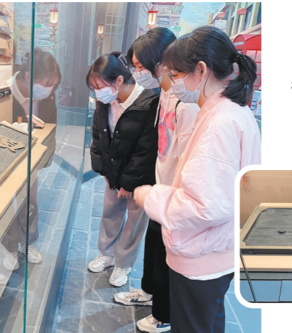
□文/图 江门日报记者 黎禹君

走进中国侨都华侨华人博物馆(以下简称“侨博馆”)“唐人街”展厅,不难发现,这里摆放着一块“身份”特殊的牌匾——美国西雅图溯源堂牌匾。说其特殊,原因有二:一是诞生于百年华侨团美国西雅图溯源堂;二是专门乘坐“专机”回到国内。美国西雅图溯源堂牌匾已拥有超百年悠久历史。在这一块匾额的背后,到底隐藏着怎样的故事?本期报道,让我们一起了解溯源堂及海外侨胞的趣事,开启一段“溯源寻根”之旅。