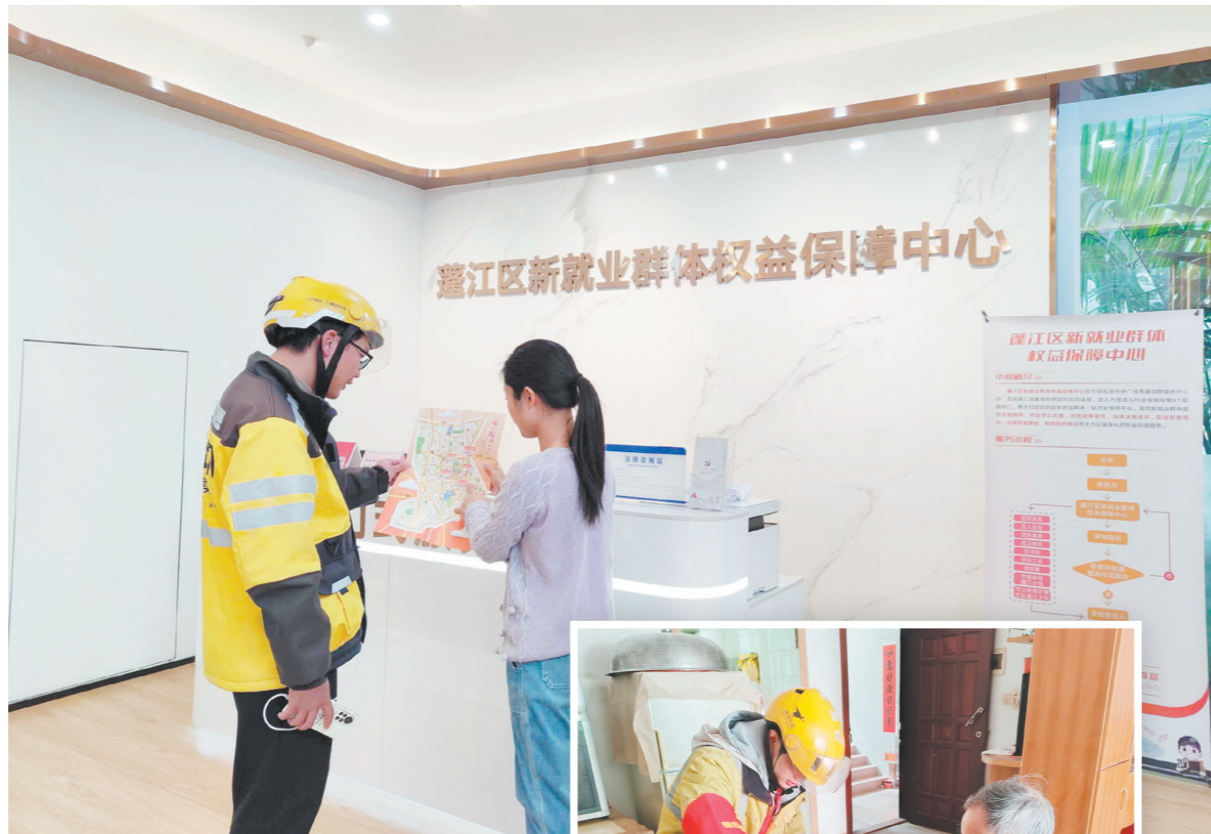
▲外卖员在权益保障中心咨询求助。