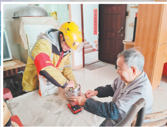
►骑手们为行动不便老人送餐。