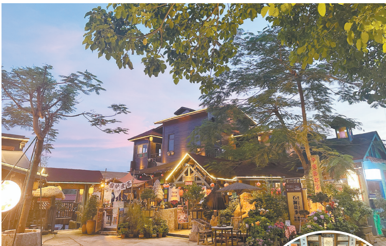
石涧故事是一家藏在山畔林间的特色民宿。