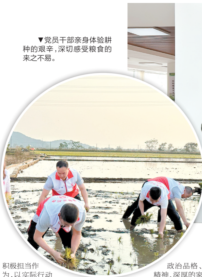
▼党员干部亲身体验耕种的艰辛,深切感受粮食的来之不易。