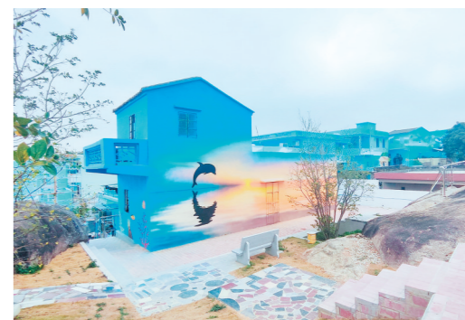
层叠而起的民居,逐一穿上了“新衣”,成为具有海、渔、港元素的“打卡点”。

江门日报讯(文/图 记者/陈方欢)近日,广海镇鲲鹏村民居的墙体大部分添上了富含海、渔、港元素的彩绘,墙体文化成为美化乡村的点睛之笔,一幅幅充满海洋气息的墙绘提升了乡村“颜值”。