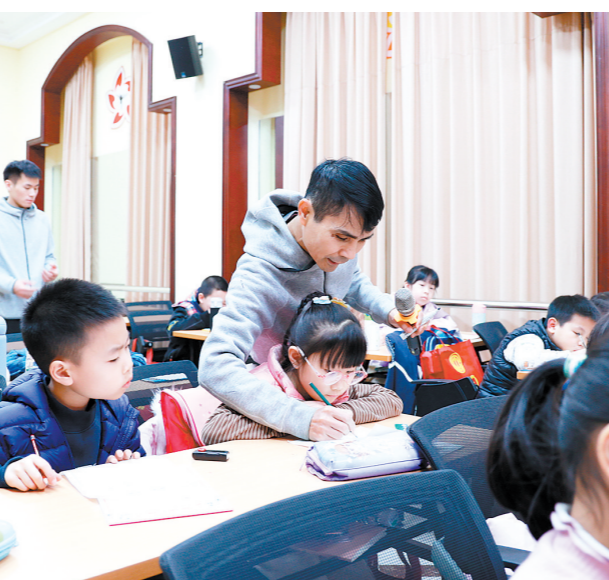
▲硬笔书法课上,教师不仅教会孩子们正确的书写姿势,还指导他们细心观察、规范书写。

在爱心托管班的硬笔书法课上,经验丰富的教师不仅教会孩子们正确的书写姿势,还指导他们细心观察、规范书写。孩子们坐姿端正、手握铅笔,一边认真观察,一边用心临摹。