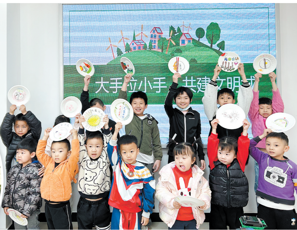
▲台山市机关事务管理局组织开展垃圾分类、节约粮食主题党建共建活动,带领机关大院党员干部及其子女投身生态文明建设。