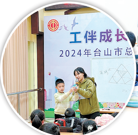
▲硬笔书法课上,教师不仅教会孩子们正确的书写姿势,还指导他们细心观察、规范书写。