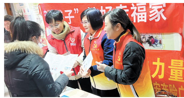
志愿者们为居民普及金融知识。

1月24日，江门市金融工作局联合江门平安财险前往江门市育德社区，开展“办实事 送温暖”社区走访慰问活动，为社区居民送温暖，做“有温度”的金融企业。