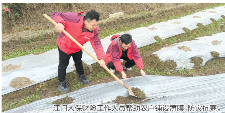
江门人保财险工作人员帮助农户铺设薄膜，防灾抗寒。