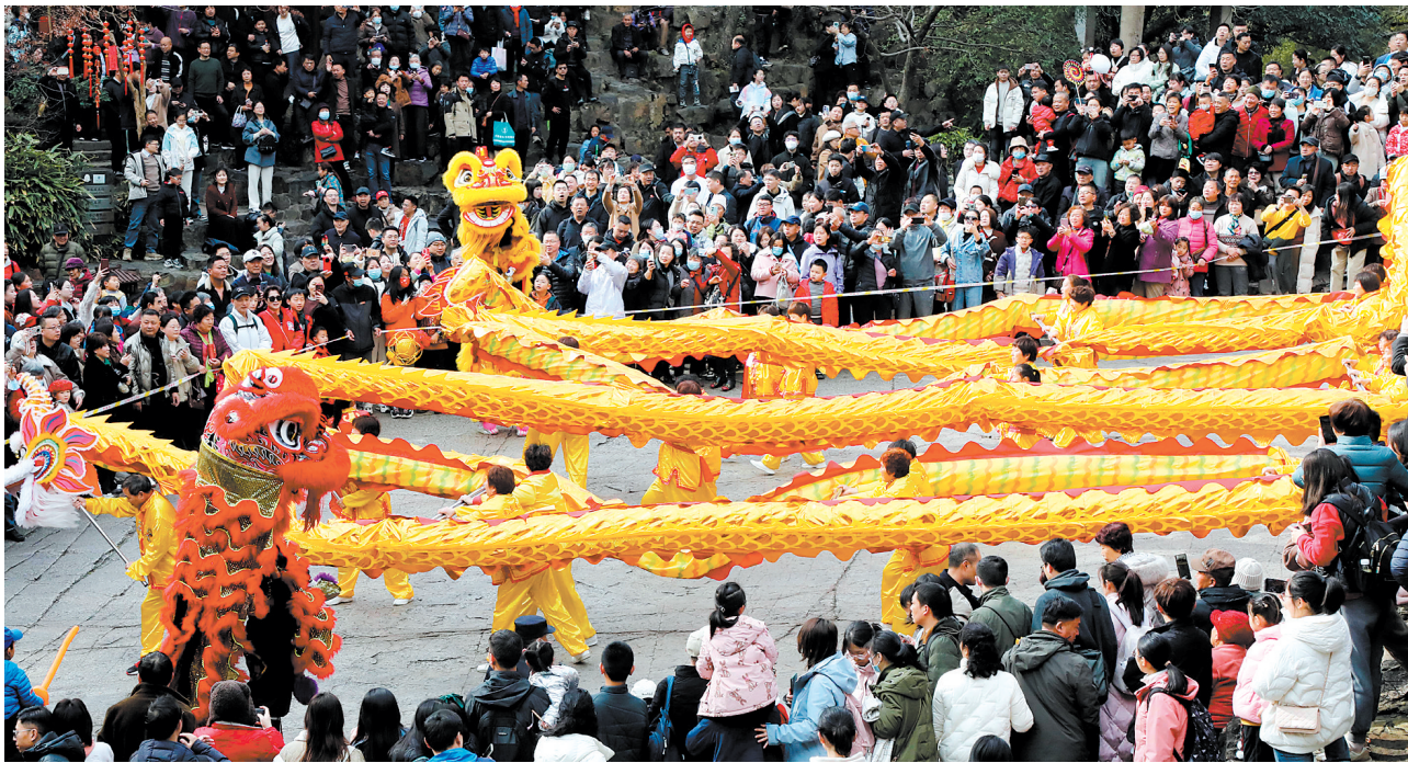
2月13日，游客在江苏苏州虎丘新春庙会上观看舞龙舞狮表演。

大年初一，跑步14公里；初二，跑步13.14公里。在朋友圈里，一位“健身达人”以跑步庆祝新年，“年少时觉得故乡很大，怕迟滞我追逐梦想的脚步；中年