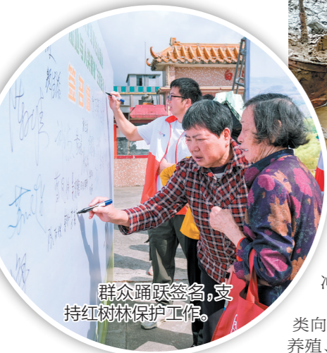
群众踊跃签名，支持红树林保护工作。