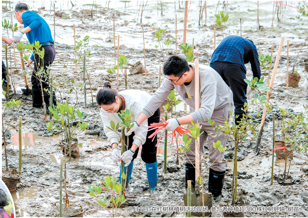
2月1日，在红树林植树活动现场，参与者种植超300株红树胚轴、树苗。