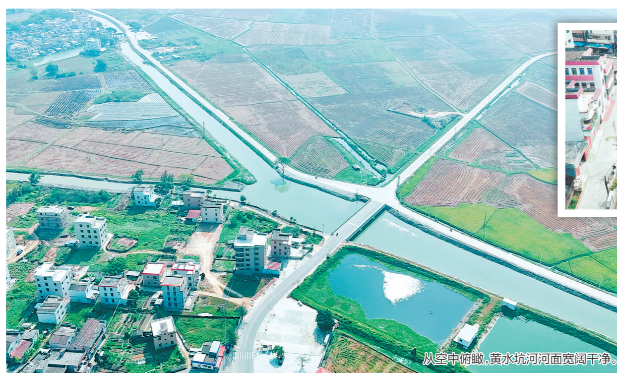
从空中俯瞰，黄水坑河河面宽阔干净。

冲河中上游及各支流共5000多米长的河道进行分段施工。经过连续的作业，目前该工程已全面完工。清淤疏浚2.7万立方米，有效改善了河道的通航与灌溉条件。