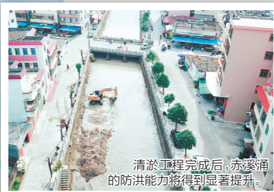
清淤工程完成后，赤溪涌的防洪能力将得到显著提升。