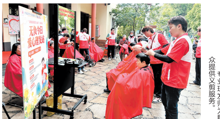
众提供义剪服务。专业理发师为群