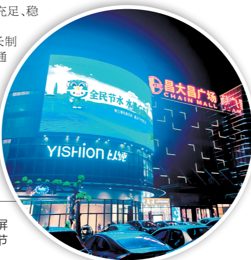
台山昌大昌广场的巨型屏幕滚动播放节水宣传标语和节水宣传视频。

台山市还注重发挥河湖长制在节水工作中的重要作用。通过实施河湖长制，加强河湖管理和保护，提高水资源利用效率，各级河湖长积极履行职责，定期开展巡河活动，及时发现并解决河湖存在的问题，推动河湖生态环境持续改善。