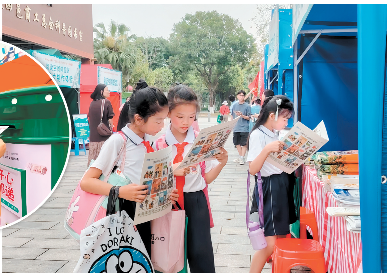
活动现场,近20个特色摊位吸引了众多市民前来逛集市、品书香。

江门日报讯(文/图 记者/李淑琦 通讯员/黄妙璇)为进一步激发全民读书热情,营造浓厚读书氛围,打造“书香味、学习范、创新型”文明城市,以阅读方式传承、传播优秀传统文化,3月29日下午,由开平市新时代文明实践中心、开平市委宣传部、开平市教育局、开平市文广旅体局、开平市文联联合举办的2024年“悦读开平·书香侨韵”全民阅读集市正式启动。