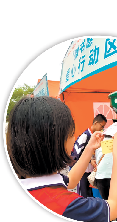
▲活动设置“开心邮递”邮筒,面向学生征集“微心愿”,帮助有需要的学生实现愿望。