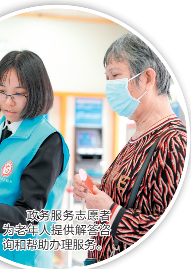
政务服务志愿者为老年人提供解答咨询和办理服务。

在智慧助老志愿服务活动中,政务服务志愿者提前上班,为老年人提供解答咨询和办理服务。尤其是在养老保险年审高峰期,志愿者主动引导老年人使用手机和“粤智助”