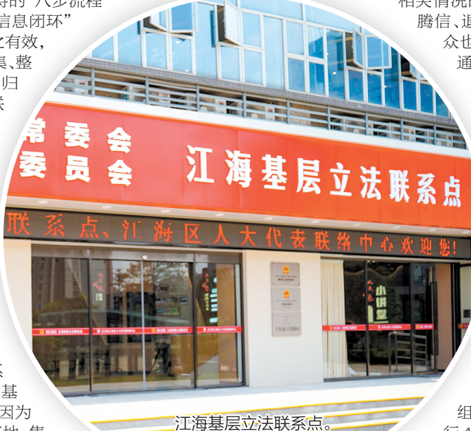
江海基层立法联系点。

目前，全省设有23个省级基层立法联系点和156个联络单位。去年，《广东省人大常委会关于进一步加强基层立法联系点建设的意见》印发，因地制宜探索实践的新思路更加清晰。以良法促进发展、保障善治，来自江海的民主法治故事必将更加鲜活而丰富。