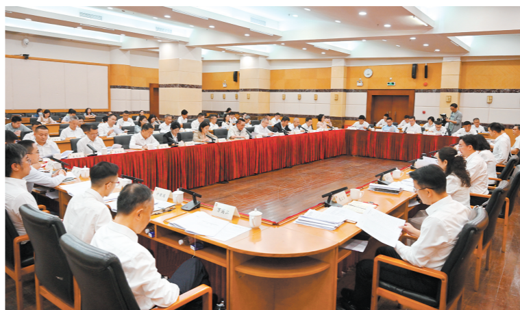
2023年10月16日,邑商·市长面对面协商座谈会首次召开,21名邑商代表、政协委员受邀出席,与江门市政府领导面对面谈现状、提问题、讲建议。

今年初市委全会提出,要加力提速奋战“百千万工程”,推动城乡区域协调发展。这也让市政协协商助力“百千万工程”的脚步,