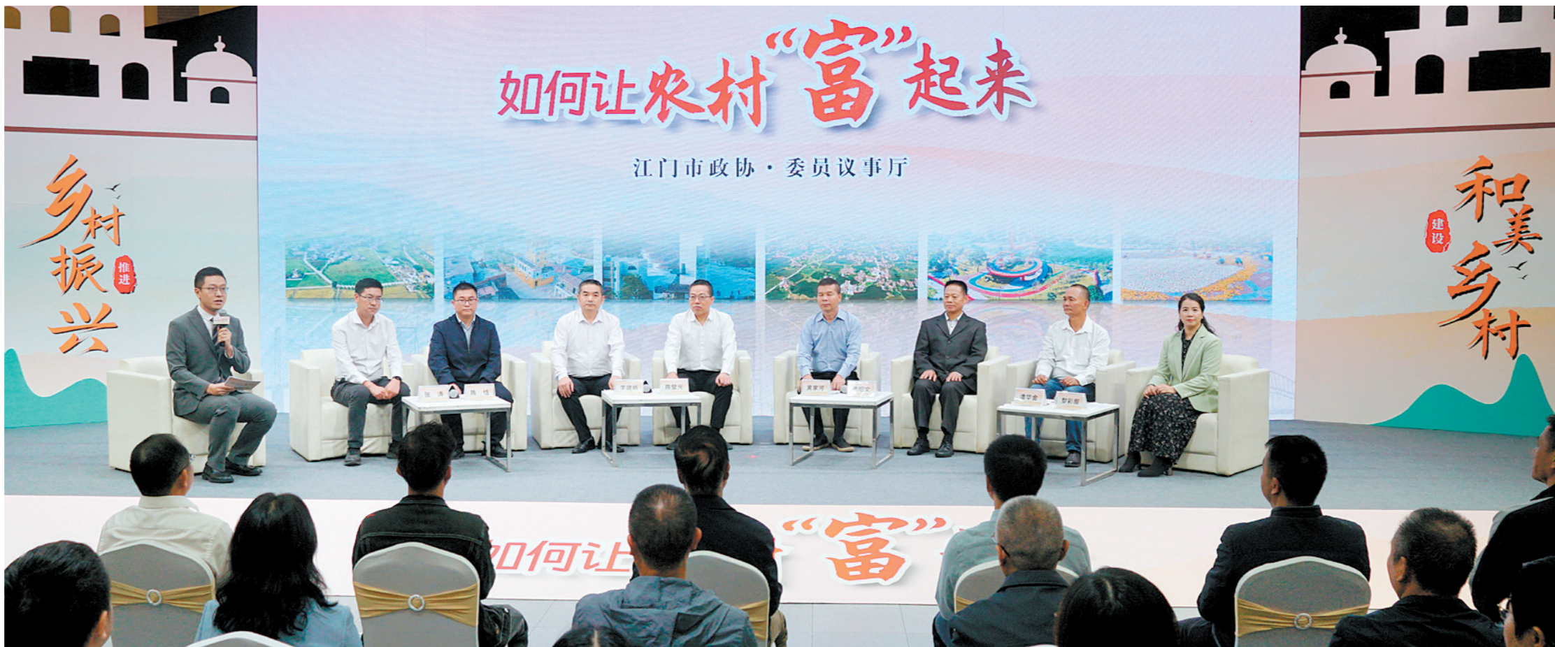
2023年12月7日,市政协“委员议事厅”聚焦“让农村富起来”开展面对面协商。