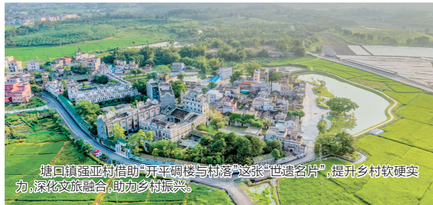
塘口镇强亚村借助“开平碉楼与村落”这张“世遗名片”,提升乡村软硬实力,深化文旅融合,助力乡村振兴。