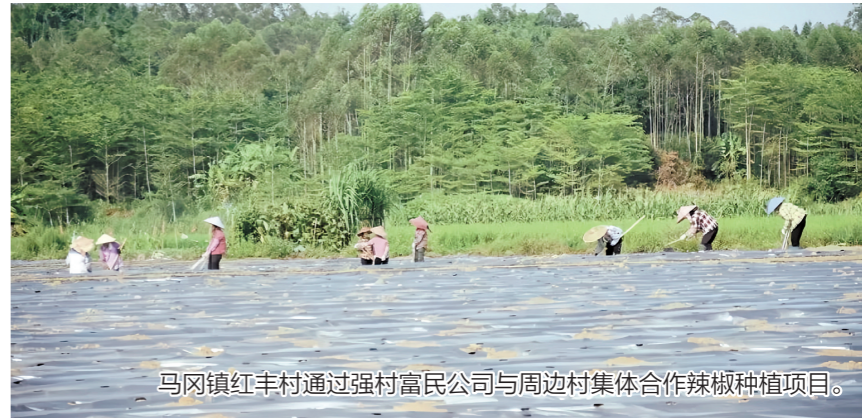
马冈镇红丰村通过强村富民公司与周边村集体合作辣椒种植项目。