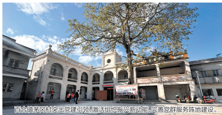
百合镇茅冈村突出党建引领,激活组织振兴新动能,完善党群服务阵地建设。

下一步,红溪村将围绕人居环境整治、乡村建设、资源整合等,继续用好积分制、清单制、无职党员设岗定责等举措,让“积分”转化为乡村振兴的“高分”,让“清单”转化为和美乡村建设的“成绩单”,使村落“活”起来,带动村民“富”起来。