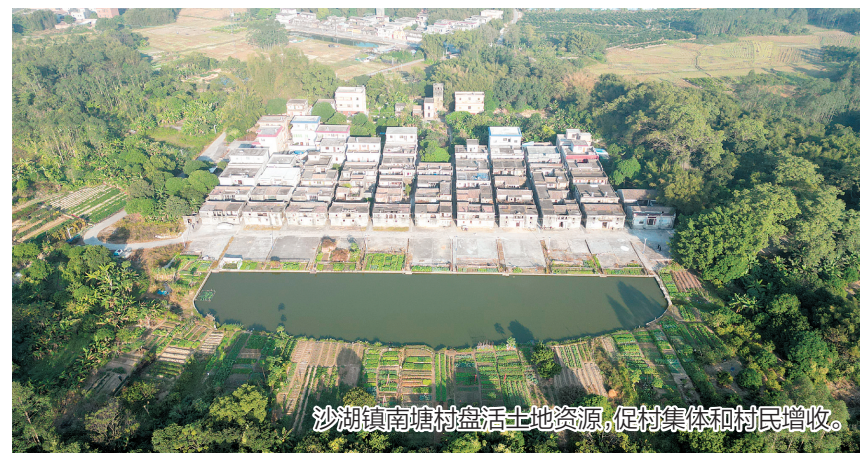
沙湖镇南塘村盘活土地资源,促村集体和村民增收。