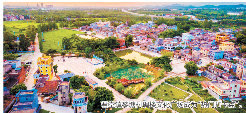
君堂镇黎塘村碉楼文化广场成为“热门打卡点”。