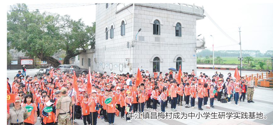
牛江镇昌梅村成为中小学生学习实践基地。