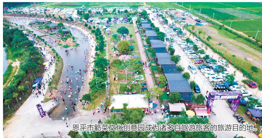
恩平市蔬菜文化创意园成为诸多自驾游游客的旅游目的地。