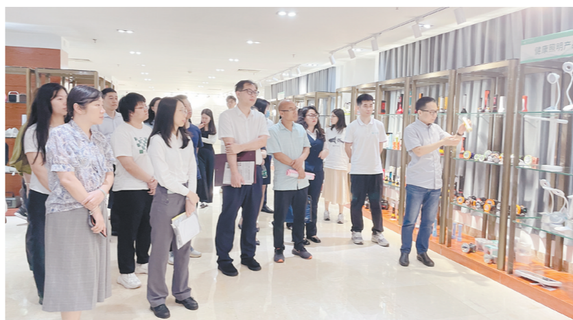
会后江门金融系统代表参观小松股份。

力、影响力、公信力。目前,江门日报社“报、网、端、微、屏”各平台建设均走在省地市报前列,全媒体用户总数已突破400万人。活动现场,江门日报社新媒体中心相关人员作短视频培训,讲解短视频拍摄技巧,助力江门金融行业创新新媒体工作思路,提升宣传业务能力水平。金融机构代表纷纷表示,随着媒体深度融合,他们将立足实际,提供更多的工作亮点、经验做法、典型事迹等新闻线索,充分发挥双方优势资源,携手合力,讲好侨乡金融故事。 会后,江门金融系统代表还参观了小松股份的产品展厅、实验室和生产车间,了解江门制造业代表性企业的家电创新产品及转型发展之道。