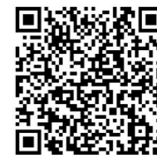
扫二维码 参与投票

进行评定。“金侨奖”2023年度江门普惠金融传媒推介活动自今年初推出以来,受到了江门市辖区内金融机构,包括银行业、保险业、证券业、融资担保、小贷公司等积极参与,引起了社会各界的广泛关注。活动分为四个阶段:第一阶段为报名启动阶段;第二阶段为展示与投票阶段;第三阶段为结果公布阶段;第四阶段为宣传表彰阶段,对上榜单位、个人、产品进行表彰,并通过媒体向社会广泛宣传。