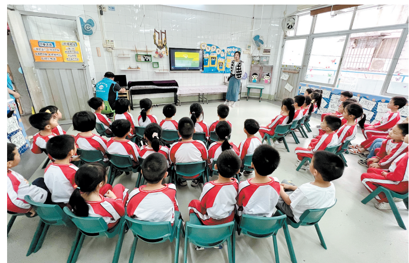
新会区节水办组织进校园，为孩子们送上节水知识。

节水进媒体，开拓宣传新模式。为进一步扩大节水宣传影响力，新会区水利局善用媒体资源，在新会广播电视台推出节水宣传小品，用轻松活泼、通俗易懂的方式，向全社会传递节水知识以及新会节水举措，营造浓厚宣传氛围。