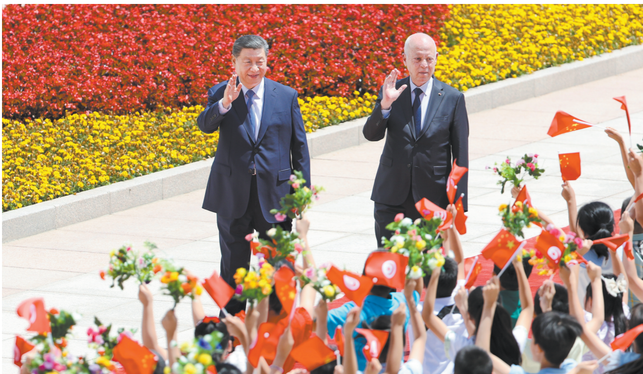
5月31日上午，国家主席习近平在北京人民大会堂同来华国事访问并出席中国—阿拉伯国家合作论坛第十届部长级会议开幕式的突尼斯总统赛义德举行会谈。这是会谈前，习近平在人民大会堂东门外广场为赛义德举行欢迎仪式。

新华社北京5月31日电 5月31日上午，国家主席习近平在北京人民大会堂同来华国事访问并出席中国—阿拉伯国家合作论坛第十届部长级会议开幕式的突尼斯总统赛义德举行会谈。两国元首宣布，建立中突全面战略合作伙伴关系。 习近平指出，中国和突尼斯是好朋友、好兄弟。建交60年来，无论国际风云如何变幻，中突双方始终相互尊重、平等相待、彼此支持，谱写了发展中国家风雨同舟、守望相助的生动篇章。巩固好、发展好中突关系，符合两国人民的根本利益和共同期待。中方愿同突方一道，赓续传统友谊，深化各领域交流合作，推动中突关系迈上新台阶。今天我们宣布建立中突全面战略合作伙伴关系，必将开辟两国关系更加美好的未来。