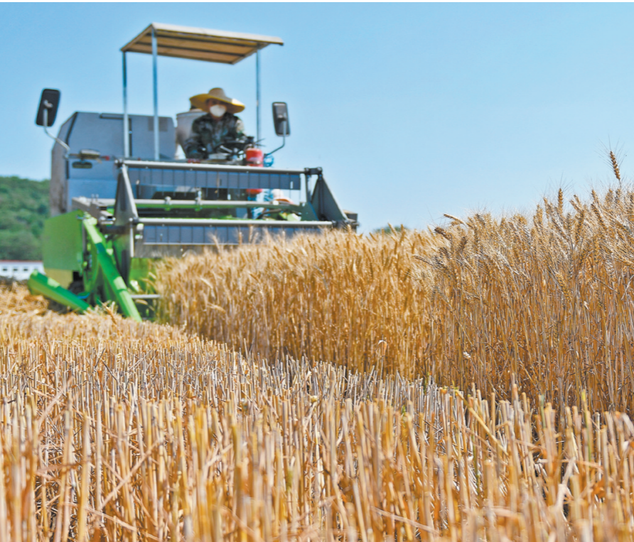
6月17日,收割机在山东省烟台市农科院冬小麦育种试验田里收割小麦。

眼下,正是“三夏”大忙时节,夏种夏管正抓紧进行。克服高温干旱影响,抢抓农时抓好夏播,各地正在行动,科学调度水利工程,精心做好抗旱保播,为秋粮丰收夯实基础。