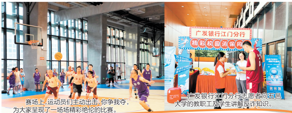
赛场上,运动员们主动出击,你争我夺,为大家呈现了一场精彩绝伦的比赛。

“不要轻信来历不明的电话、信息,不要向陌生人透露自己及家人的身份信息……”现场,广发银行江门分行志愿者结合各类典型诈骗案例,向观众讲解了刷单返利类、贷款类、交友类等诈骗方式,并重点讲述了防范电信诈骗的知识。现场观众积极与前来宣传的志愿者互动,大家在欢声笑语中提升了反诈防骗的意识和能力。