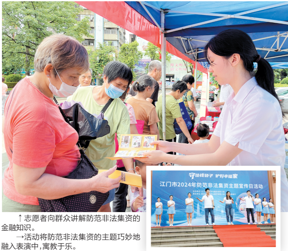
↑志愿者向群众讲解防范非法集资的金融知识。 →活动将防范非法集资的主题巧妙地融入表演中,寓教于乐。

记者了解到,下阶段,在江门市处置非法集资领导小组的指导下,结合全国、全省、全市开展的打击非法集资专项行动,我市有关部门、监管机构与各金融机构将进一步深化联动机制,坚持聚焦重点领域、重点人群,拓宽宣传渠道,创新宣传教育模式,切实提升防范非法集资宣传覆盖面、精准度、渗透力,夯实群众金融素养基础,为江门市构建安全、稳定、和谐的金融环境。