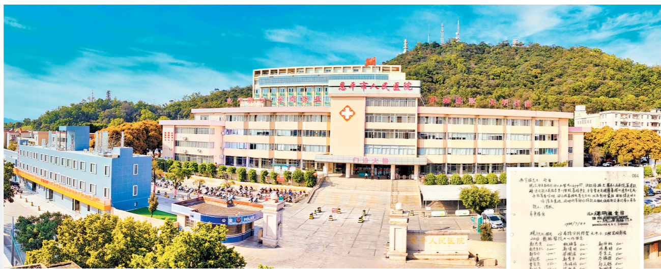
↑1989年建成并投入使用的恩平人民医院如今依然是恩平市医疗卫生事业的顶梁柱。

文物名称：恩平市海外侨胞港澳同胞为新建恩平人民医院捐资赠物侨批 年代：1982—1989年 馆藏方：恩平市档案馆 馆藏地点：恩平市档案馆