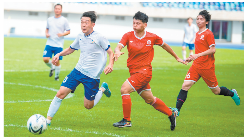
队员们在场上展开激烈的拼抢。

江门日报讯6月22日下午，中国体育彩票·2024江门市“嘉应科创园”足球超级联赛在江门体育中心足球场举行颁奖仪式，江门开心队、江门客联队、鹤山足协队分获积分榜前三名。