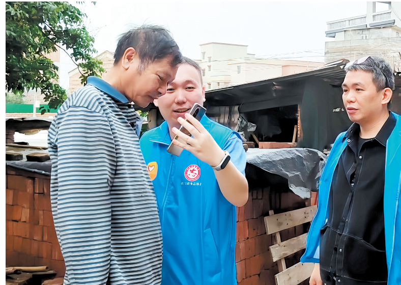
工作人员耐心为老年人操作手机,进行养老保险待遇资格认证。

接下来,开平市将加强政策宣传和培训,提高用人单位和行业协会的依法参保意识,提升镇村干部和社保工作人员的政策解读及服务能力,持续更新和分析社保数据,及时通报基本养老保险提质增效的进展情况,确保各相关部门和机构能有效推动政策执行。