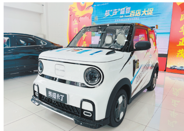
吉利熊猫卡丁采用了小方盒子造型,整体十分具有辨识度。

近日,吉利汽车旗下熊猫家族新成员——A00级微型车熊猫卡丁亮相吉利江门鑫源4S店,官方指导价4.69万元。