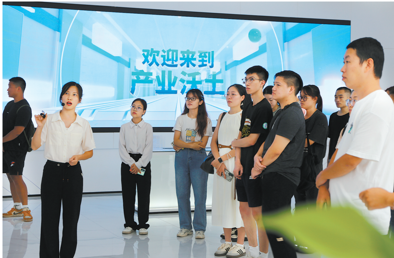
棠下本土青年参观了解家乡近年来的发展成果。

“既有高楼大厦，也有乡村美景，还有大型产业园资源，家乡的变化让我大开眼界。这次座谈会，我收获颇丰，真切感受到政府建设棠下镇的热情和决心，希望能更多了解棠下镇。”为鼓励更多“游雁”回乡“筑巢”，8月27日，蓬江区棠下镇举行高校毕业生返乡就业创业座谈会，邀请辖区即将或刚毕业的棠下籍青年返乡参观交流、归“棠”筑梦，棠下镇的变化和机遇得到大家的认可。