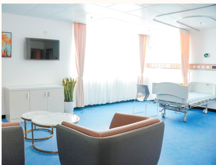
新建的外科楼病房环境十分温馨。

精彩的华章，总在接续奋斗中书写。2023年，该院新增市级临床重点专科建设项目10个、省临床重点专科建设项目2个；新申报新技术新项目44项，其中填补市内空白11项；新增“广东省卫生健康适宜技术推广项目”5个，取得了较好的辐射影响力和社会效益。