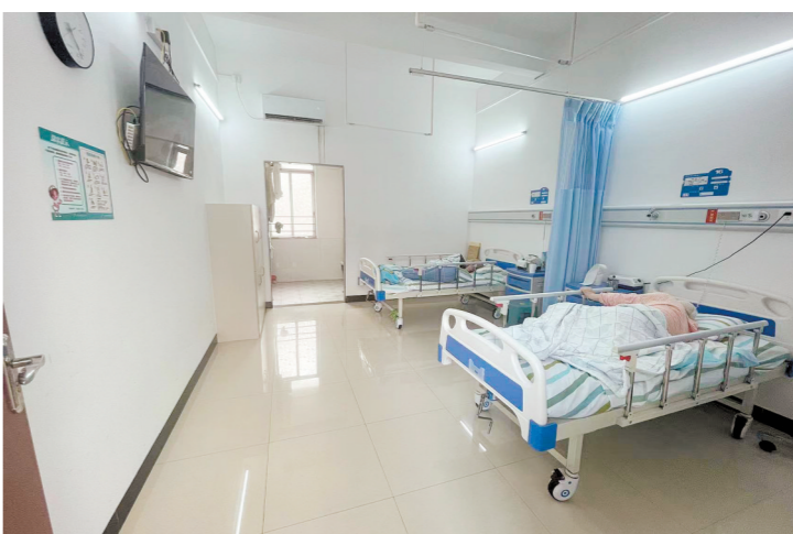
江门市结核病防治所着力改善院区环境，为患者提供优质服务。

除此之外，该所还在硬件设施建设上持续发力。近年来，改造并升级了PCR实验室，引入了多项先进的设备与检测技术，如螺旋CT和Genex-pertMTB/RIP检测系统等，为结核病的早期筛查和精准诊断提供了强有力的技术支撑。