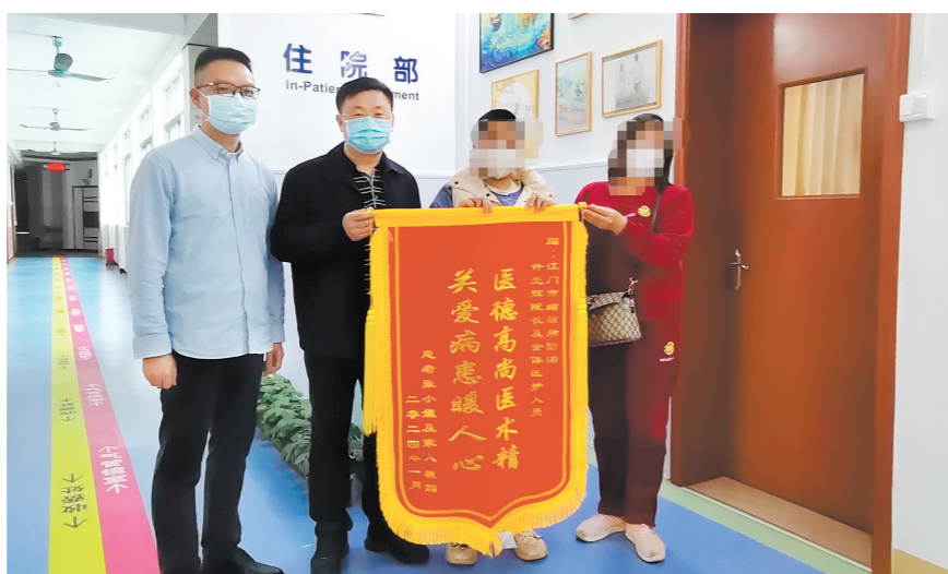
患者康复后向江门市结核病防治所赠送锦旗表示感谢。