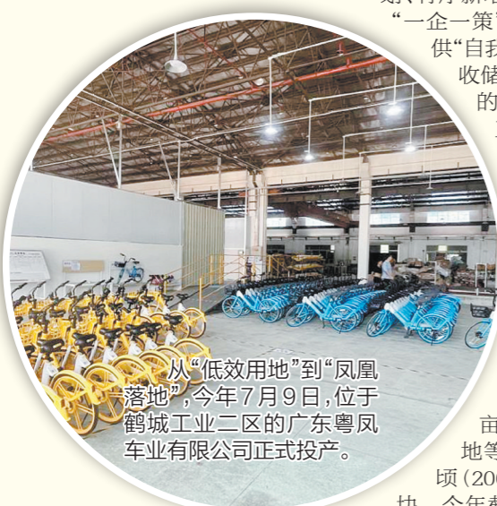
从“低效用地”到“凤凰落地”，今年7月9日，位于鹤城工业二区的广东粤风车业有限公司正式投产。

奋力拥抱“大桥经济”新机遇。鹤山市有关方面负责人表示，接下来将继续纵深推进盘活存量用地工作，对标任务目标，开展闲置土地、低效厂房排查，精打细算管理好已有土地资源，唤醒“沉睡”土地资源，坚定不移推进“工改工”项目，全力破解要素制约、空间瓶颈，为重点项目赋能增效，与企业共同推动经济社会高质量发展迈上新台阶。