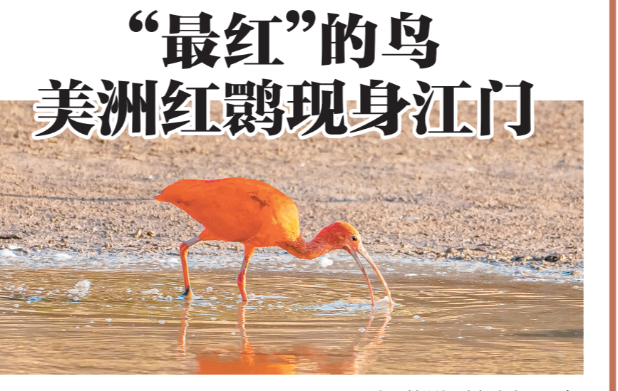
这只美洲红鹮在浅水区觅食。

“国庆期间，我们首次发现了这只鸟。因为本地没有美洲红鹮种群，我们推测它可能是动物园里逃出来的。美洲红鹮喜欢捕食泥滩中的蟹类、小鱼、昆虫等，而礼乐这边鱼塘和优越的自然环境为它提供了丰富的食物来源和理想的栖息地，所以它选择在这里觅食。也希望见到它的市民文明观鸟，不要惊扰它正常觅食。”观鸟爱好者“非林”说。