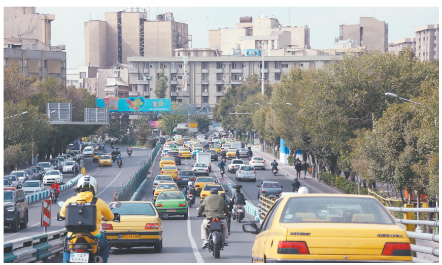
10月26日，车辆行驶在伊朗首都德黑兰街头。

伊朗西亚问题资深专家赛义德·礼萨·萨德尔·侯赛尼告诉新华社记者，以色列进行打击前，伊朗所有军事和国防设施都已做好必要准备，伊朗武装部队