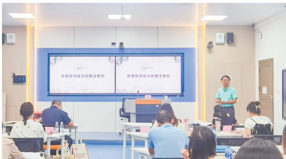
江门职业技术学院一直致力提升电子商务专业教学质量。