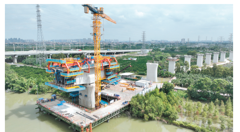
智慧造桥机正在“打印”桥梁。

江门日报讯(记者/胡晴晴 通讯员/李剑)记者昨日从江海区住房和城乡建设局了解到，在中铁二十五局深江铁路12标施工现场，一台多功能悬臂智慧造桥机像巨型3D打印机一样正在“打印”桥梁，经过建设者历时7天的浇筑、张拉、养护等数十道工序，跨江门水道连续梁327号墩第二节连续梁顺利浇筑完成，标志着智慧造桥机在深江铁路江门段建设中首次成功运用。